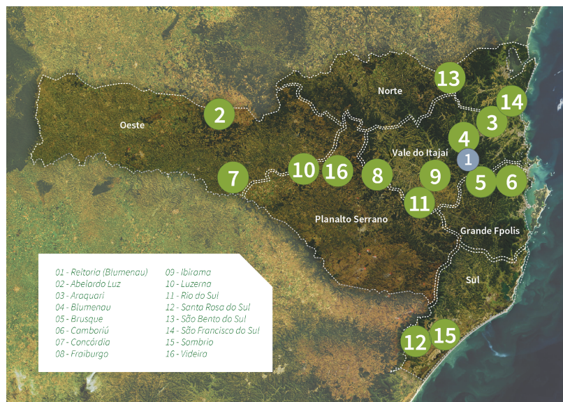
Figura 01: Mapa de abrangência institucional

A trajetória formativa do IFC se integra às demandas sociais e aos arranjos produtivos locais/regionais com cursos da educação profissional e tecnológica: qualificação profissional, educação profissional técnica de nível médio, graduação e pós-graduação – lato e stricto sensu.